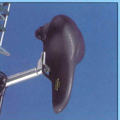
Selle Royal 8270 zadel met elastomere vering en snake dek.